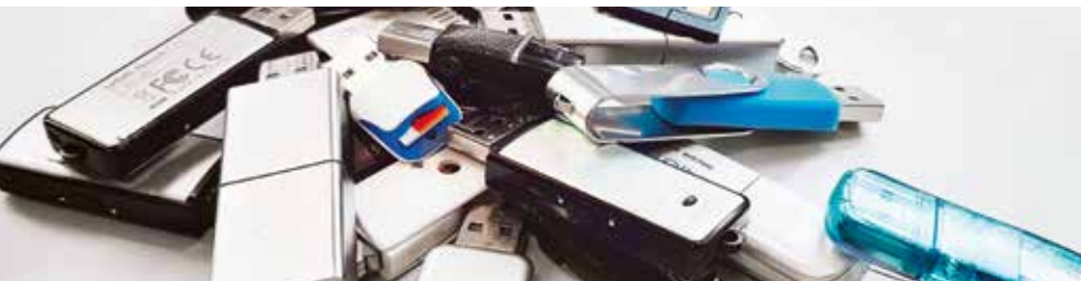
Verloren im Daten-Dschungel... und nun?

Im Zuge der Digitalisierung der Wissenschaft hat die Menge und die Komplexität von digitalen Forschungsdaten zugenommen. Gleichzeitig ist ein Bewusstsein dafür entstanden, diese Daten nachhaltig zu speichern und somit für die Zukunft zu erhalten. Dies ermöglicht eine Nachnutzung und eine Überprüfbarkeit von Forschungsergebnissen, wenn die zugrundeliegenden Forschungsdaten gut dokumentiert und in möglichst standardisierter Form in eine öffentlich zugängliche Infrastruktur integriert werden. Zusätzlich haben seitens der Forschungsförderer die Anforderungen für einen geregelten und