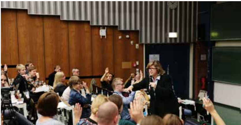
Prof. Dr. Renee Hobbs über »fake news« und neue Formen der Internetpropaganda

Über drei Tage diskutierte das ZfL mit Akteur_innen aus Wissenschaft, Schule und Wirtschaft, wie sich das Lehren durch digitale Einflüsse verändern muss, um Lernende optimal auf die bevorstehenden Anforderungen vorzubereiten. Die Inhalte der Tagung beschäftigten sich dabei in unterschiedlichster Weise mit den drei Schwerpunkten: #education, #brain, #work&play.