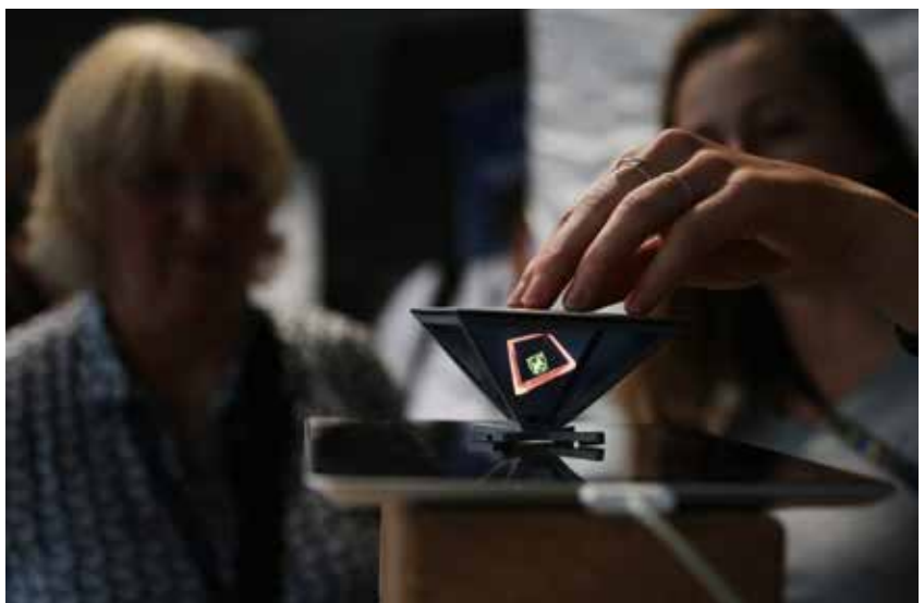
Interaktive Hologramm-Illusionen für Smartphones und Tablets mit JUWL