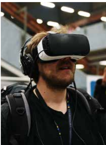
Neue Lernangebote mit Virtual Reality

Universität Bonn und Lead Scientist für Maschinelles Lernen am Fraunhofer Institut (IAIS), den Zuhörer_innen beim Eröffnungsvortrag der Diggi17-Tagung nahebrachte.