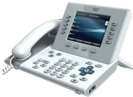
Cisco Unified IP-Telefone 9951 und 8961